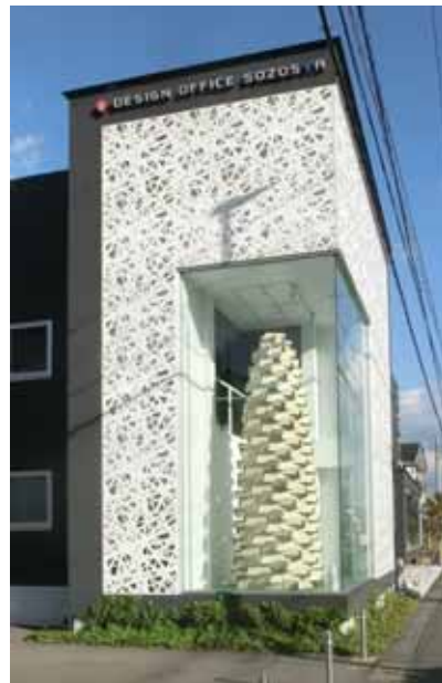
外観。作品の高さは約4.5m