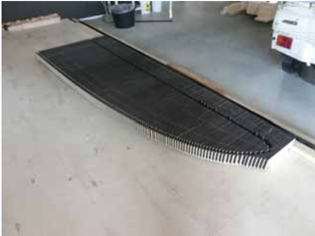
177本の部材を並べる